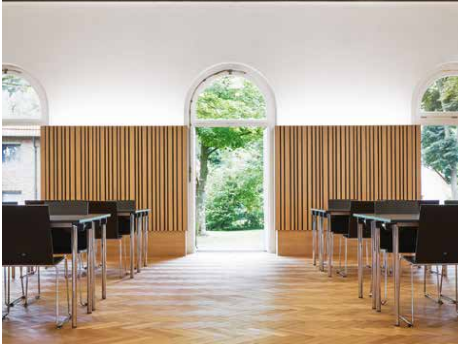
Eine Kultur der Offenheit und Öffnung – nach innen und außen