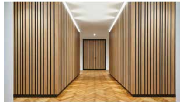
Die Materialkomposition reduziert sich auf Eichenholz und Metall.