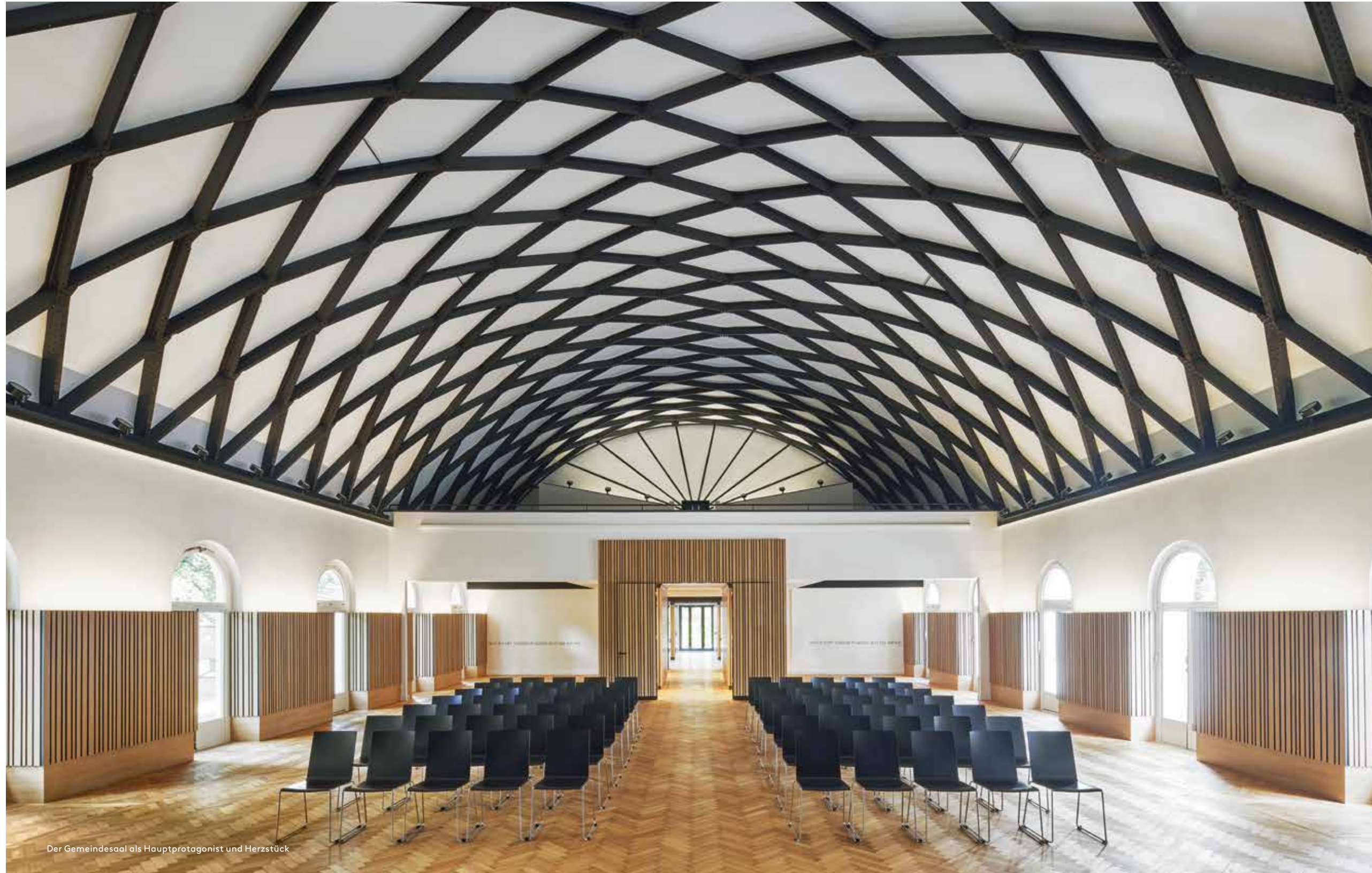
Der Gemeindesaal als Hauptprotagonist und Herzstück